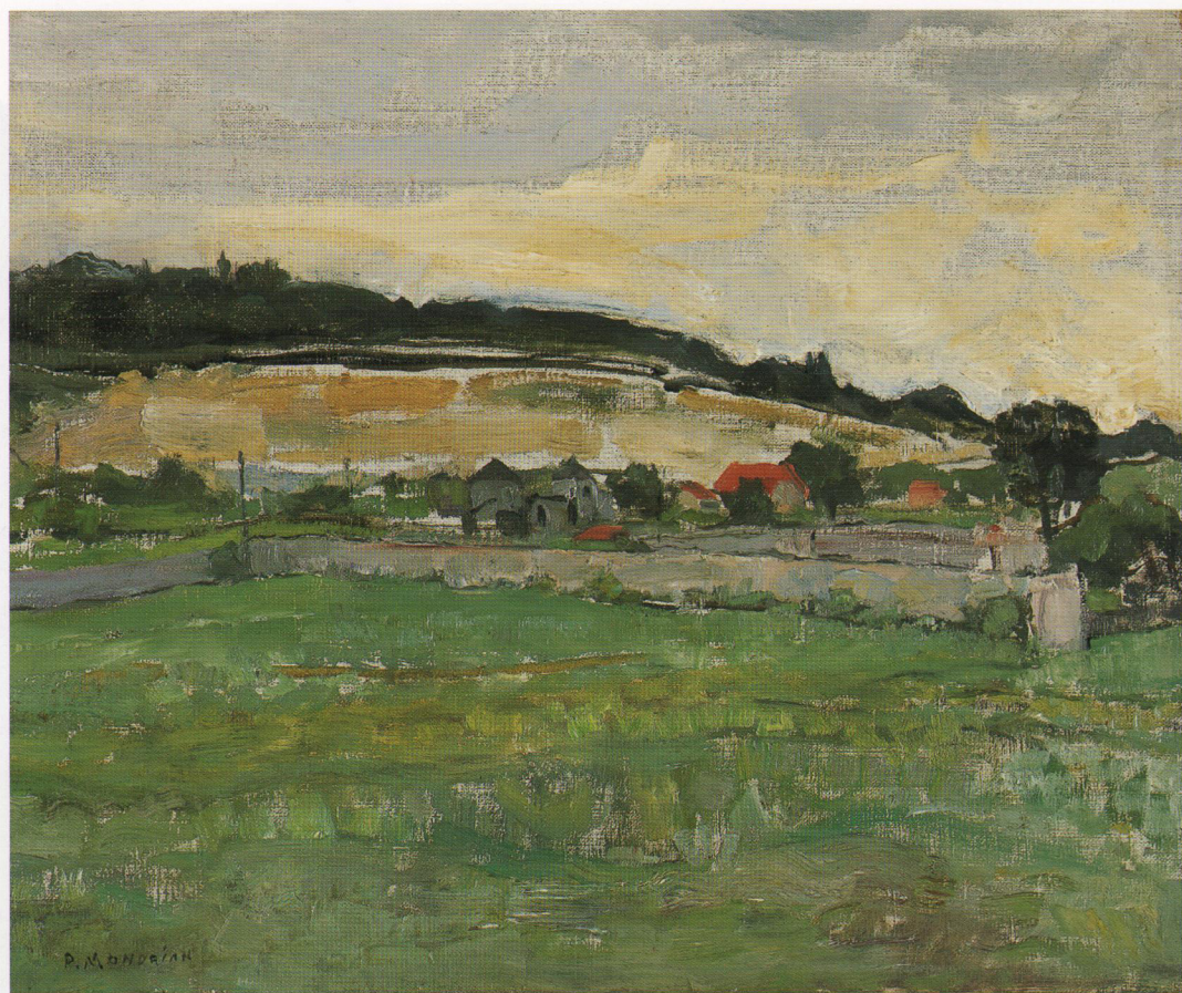
2. P.C. Mondriaan, Landschap bij Montmorency , olie/doek, 46,3 x 55,2 cm, gesigneerd en verso gedateerd 8 aug. '30 Coll. Simonis & Buunk Kunsthandel.