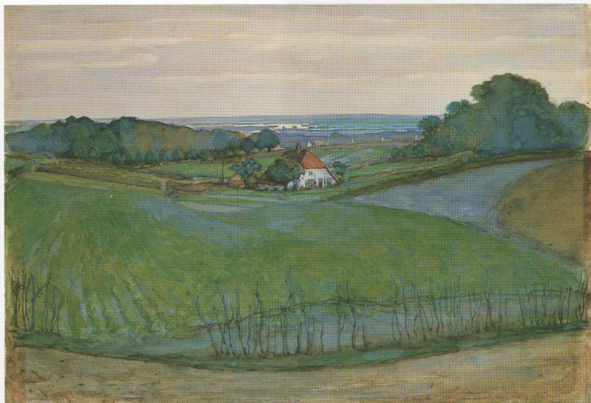
4. P.C. Mondriaan, Bij Arnhem , aquarel/gouache/papier, 46 x 65 cm, gesigeneerd en te dateren 1901. Part. collectie.