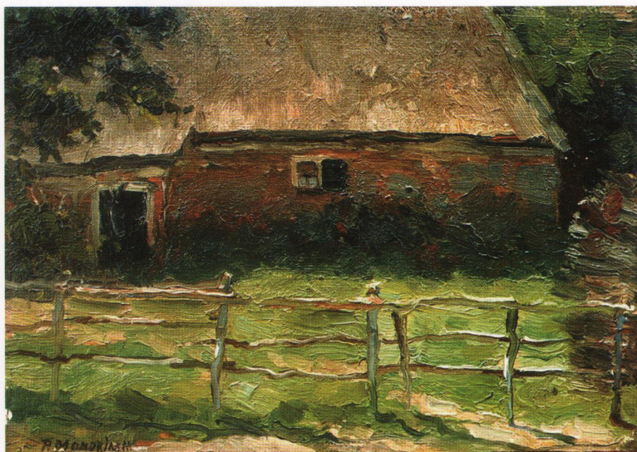
5. P.C. Mondriaan, Boerderijtje achter een hek , olie/paneel, 20,5 x 29,1 cm, gesigeneerd en te dateren ca. 1904. Coll. Simonis & Buunk Kunsthandel.