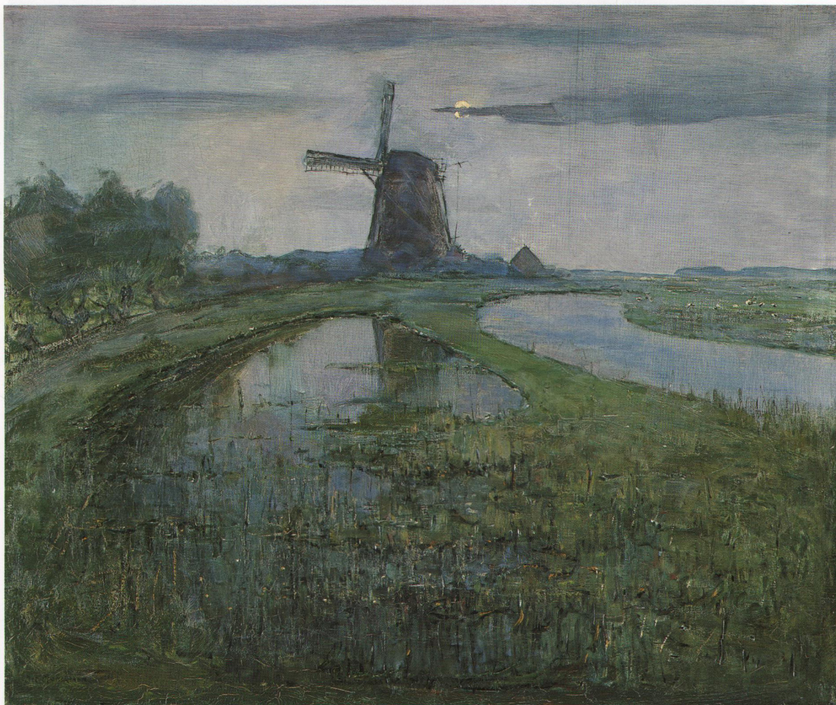
1. P.C. Mondriaan, De Oostzijdse Molen aan het Gein bij maanlicht , olie/doek, 63 x 75,4 cm, gesigneerd en te dateren 1902 - 1903. Coll. Simonis & Buunk Kunsthandel.