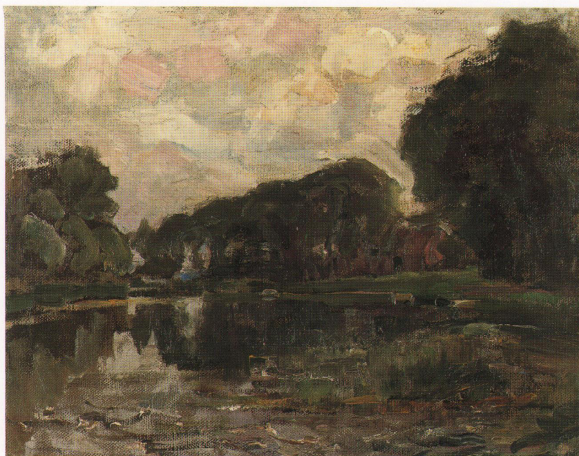
6. P.C. Mondriaan, Boerderij met lange bomenrij aan het Gein , olie/doek, 35,8 x 45,3 cm, te dateren 1905 - 1907. Coll. Simonis & Buunk Kunsthandel.

werk af. Het werd in 1904 geschonken aan een Deens echtpaar en is daarna tot 2000 in dezelfde familie gebleven. In dat jaar werd het verworven door een Scandinavische verzamelaar, bij welke gelegenheid het is 'ontdekt'.