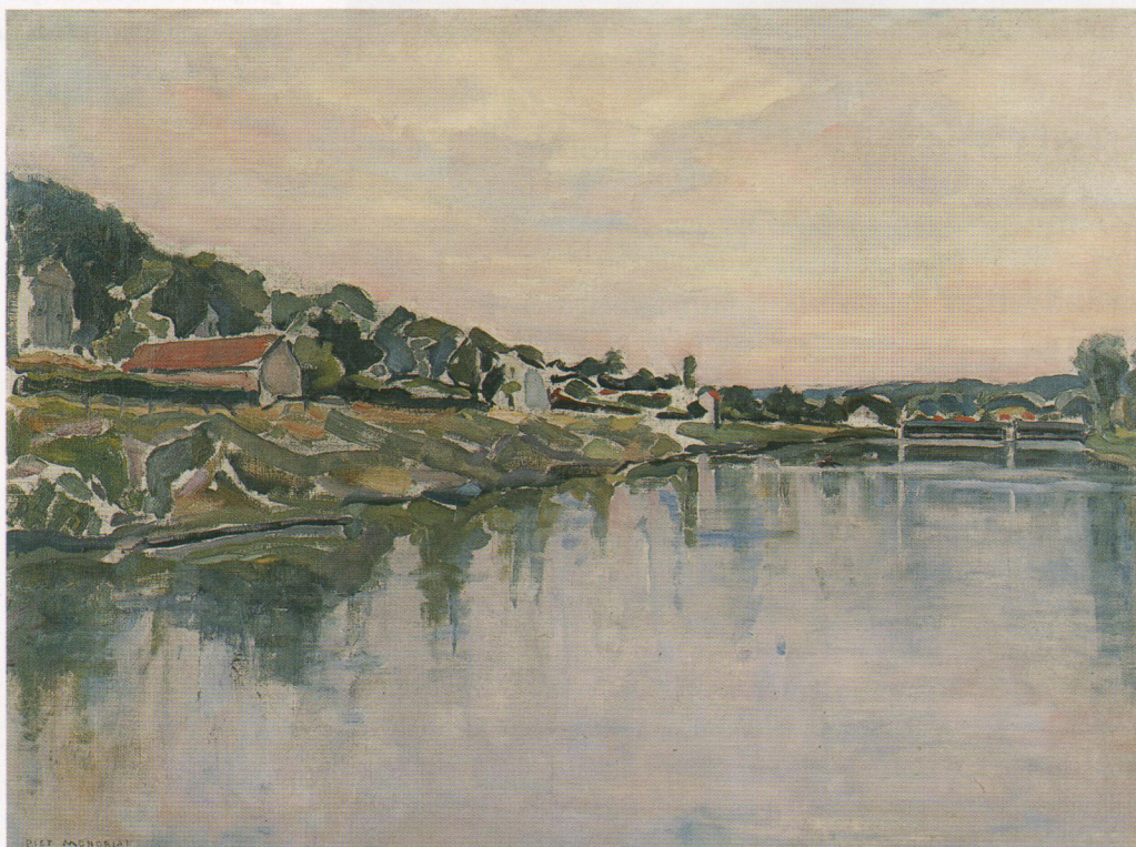
3. P.C. Mondriaan, De Oever van de Seine , olie/doek, 54,2 x 73,1 cm, gesigneerd en te dateren 1929. Part. collectie.